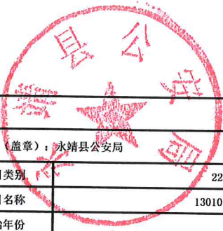
2023年预算项目绩效目标表