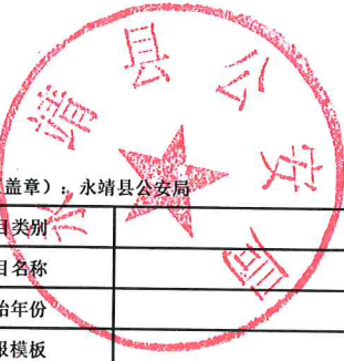
2023年预算项目绩效目标表