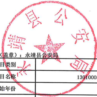
2023年预算项目绩效目标表