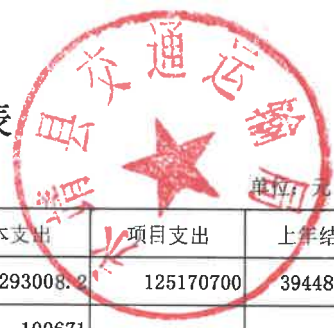
部门支出总体情况表